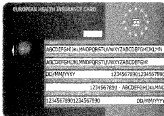
- Vorderseite -

Diese Staaten verwenden ein gemeinsames, nachfolgend abgebildetes Muster der Europäischen Krankenversicherungskarte (EHIC).